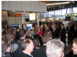
Angela Merkel am Stand des Bundesministeriums für Forschung

Beteiligt an diesem Projekt ist neben der Berliner Feuerwehr auch die FU Berlin. Unterstützt wird es vom Bundesministerium für Bildung und Forschung.