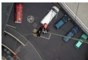
Höhenretter beim Abstieg