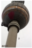
Blick zum Fernsehturm