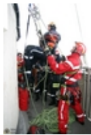
Vorbereitung zum Abseilen

Bei dieser Übung wurden neue Methoden der Evakuierung auf dem Prüfstand gestellt und das aktuelle Rettungskonzept nicht in Frage stellt. Das aktuelle Rettungskonzept sieht im Gefahrfall eine Evakuierung der Fernsehturm-Kugel vor, in dem alle Personen vom Personal in die beiden unterhalb der Kugel angeordneten Rettungsplattformen geführt würden. Diese sind sicher und bieten 400 Menschen Platz. Wäre der Brand von der Feuerwehr gelöscht, könnten die Betroffenen anschließend entweder per Aufzug oder über die innen liegende Treppe ins Freie gelangen.