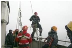
Schritt über die Reeling