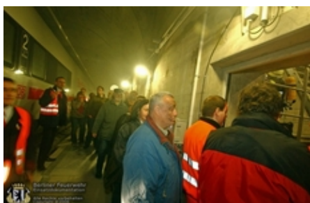
Personen werden zum Rettungsaufgang gebracht

Die Bilder der Übung aus dem Tunnelbereich mit freundlicher Genehmigung der Deutschen Bahn AG.