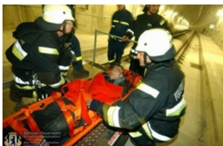
Rettung mit Rettungslore