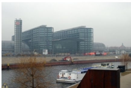
Verletzensammelstelle vor dem Hauptbahnhof